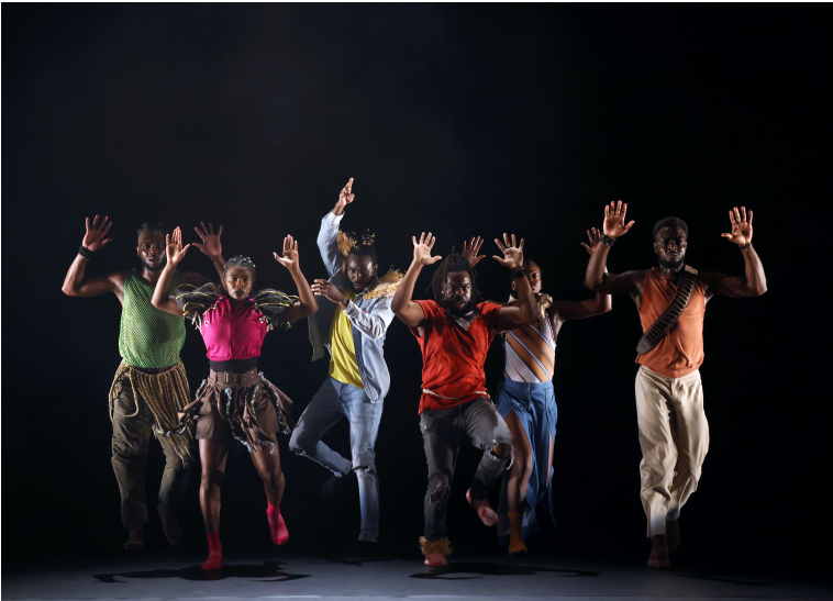
Matière(s) première(s) - ©Patrick Berger

hip-hop au plateau. Pour moi, cette pièce est incontournable dans mon répertoire. En ce qui concerne la notion d'héritage, je l'aborde dans d'autres pièces, comme Matière(s) première(s), que j'ai créé en 2023, ou [Superstrat], créé en 2025 : ces deux spectacles font le lien entre danses traditionnelles africaines et danses afro-descendantes, comme les différentes danses hip-hop issues du continent américain.